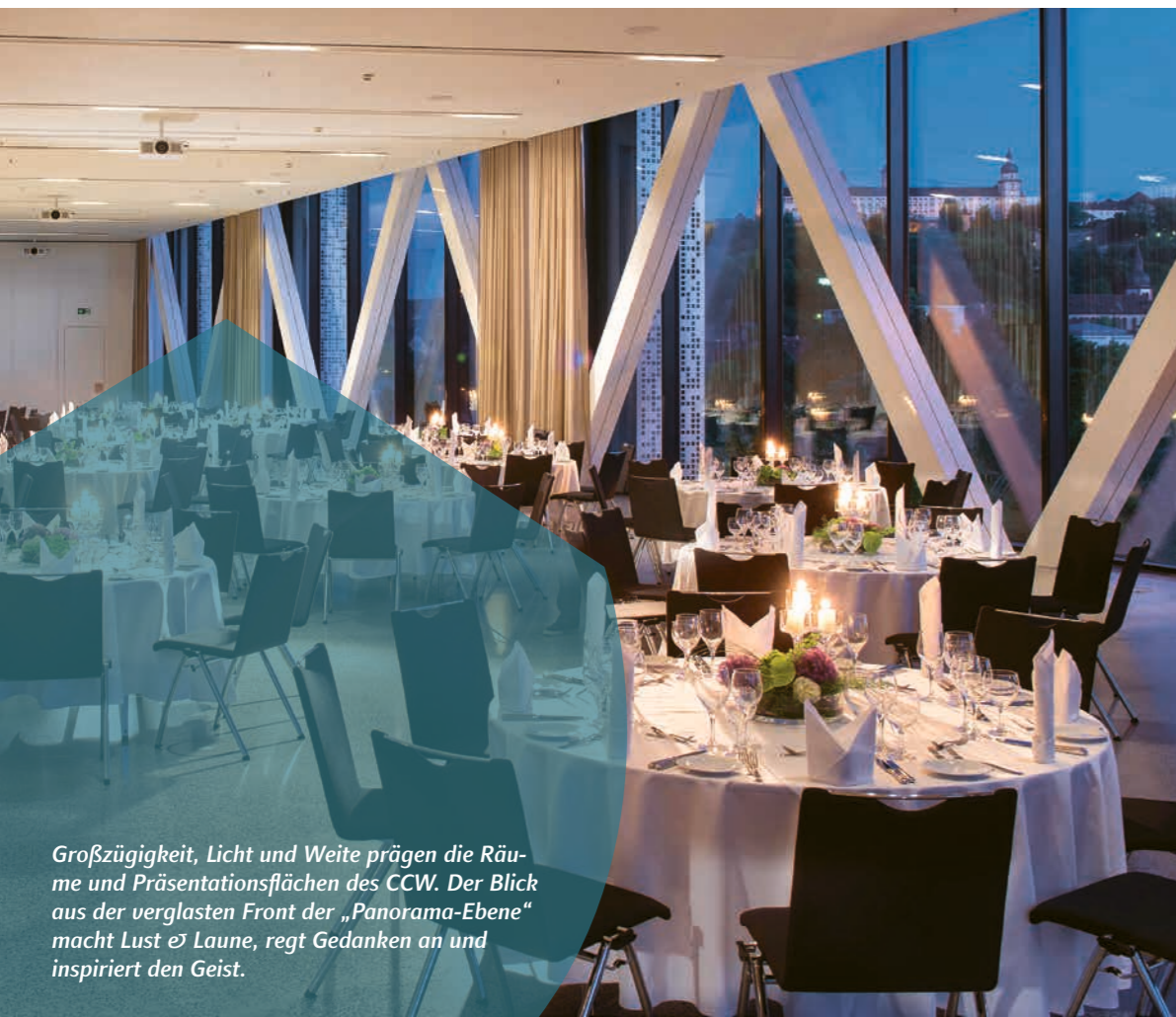
Großzügigkeit, Licht und Weite prägen die Räume und Präsentationsflächen des CCW. Der Blick aus der verglasten Front der „Panorama-Ebene“ macht Lust auf Laune, regt Gedanken an und inspiriert den Geist.