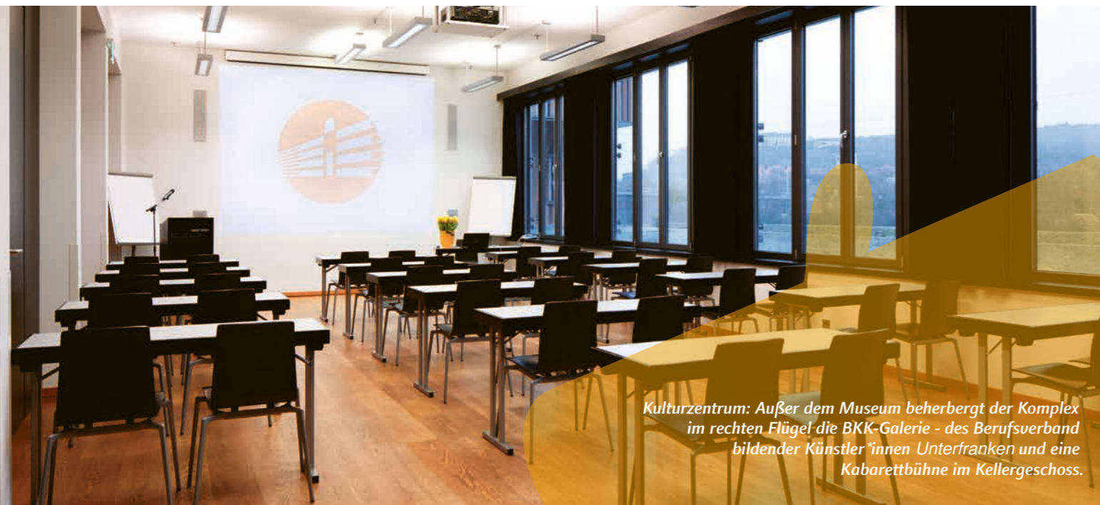
Kulturzentrum: Außer dem Museum beherbergt der Komplex im rechten Flügel die BKK-Galerie - des Berufsverband bildender Künstler*innen Unterfranken und eine Kabarettbühne im Kellergeschoss.

A3 Köln-Würzburg-München A7 Hannover-Würzburg-Ulm A81 Stuttgart-Heilbronn-Würzburg